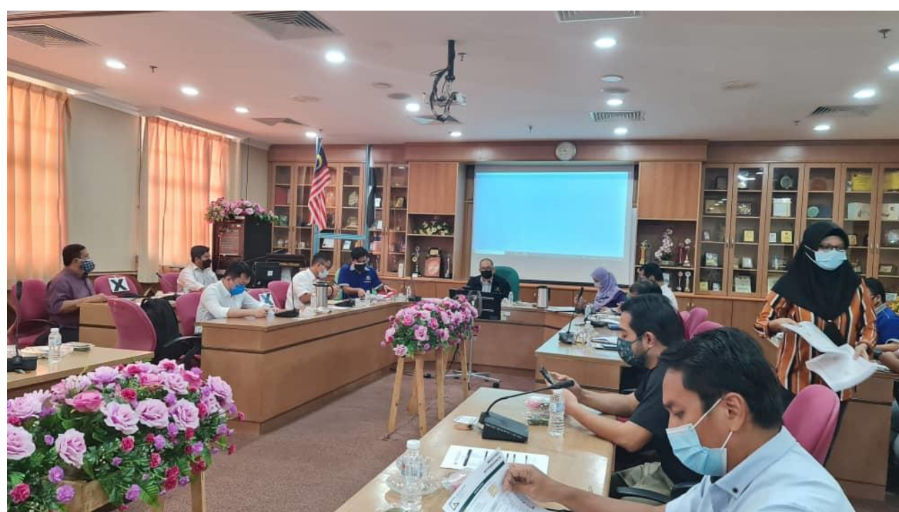
Mesyuarat Hospital Pekan yang dipengerusikan oleh Timbalan Pengarah Sektor Implementasi Projek