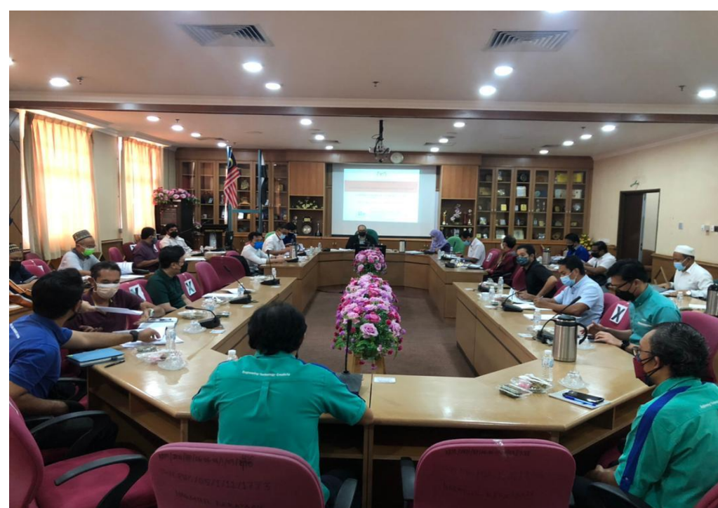
Mesyuarat Tapak di Hospital Pekan