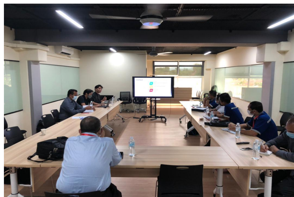
Pembentangan Pengenalan kepada Building Information Modelling (BIM) kepada Sektor Implementasi Projek, KKM