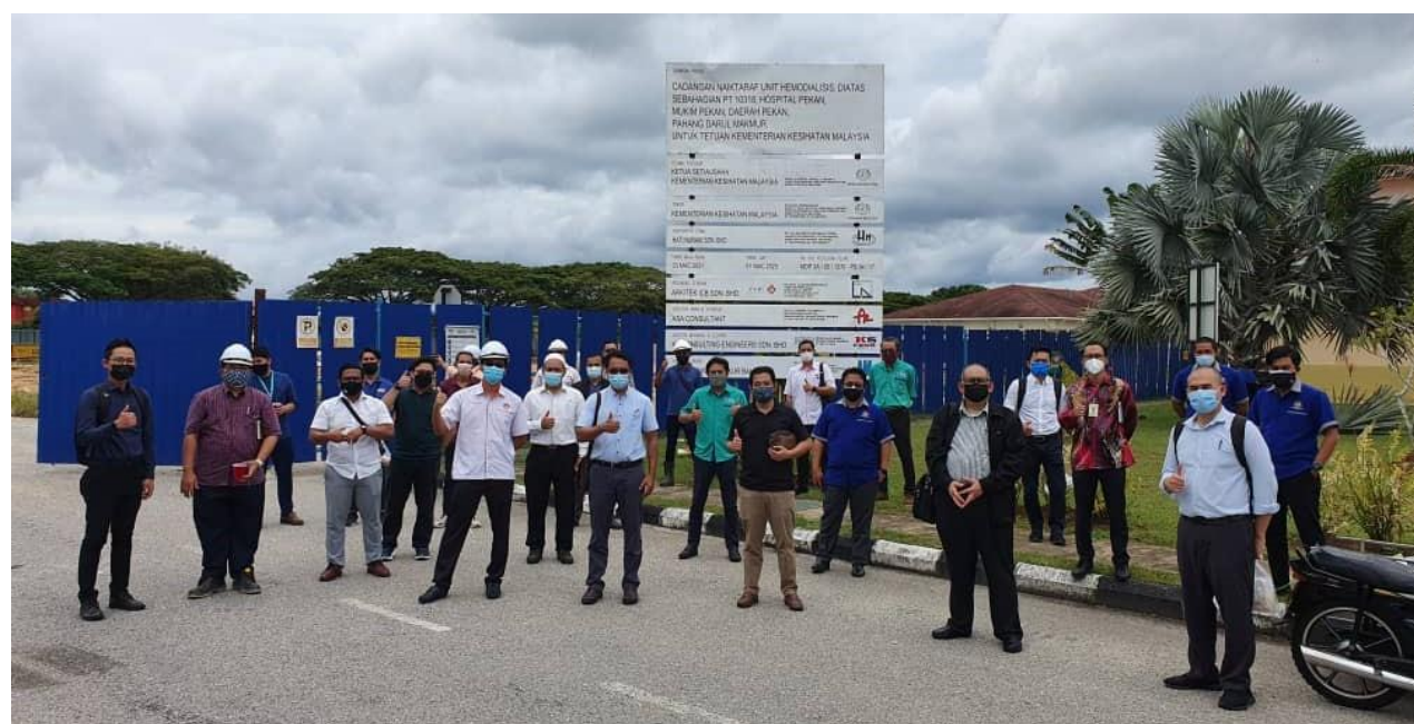
Lawatan tapak projek Pembinaan Pusat Homodialisis, Hospital Pekan